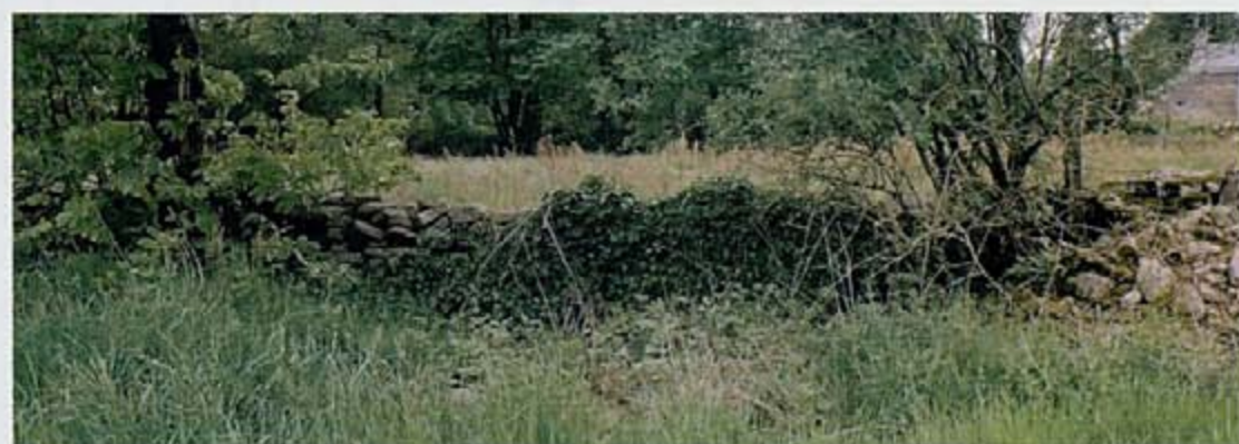
Fig. 5 : photographies des murets actuels de limite de parcelles.