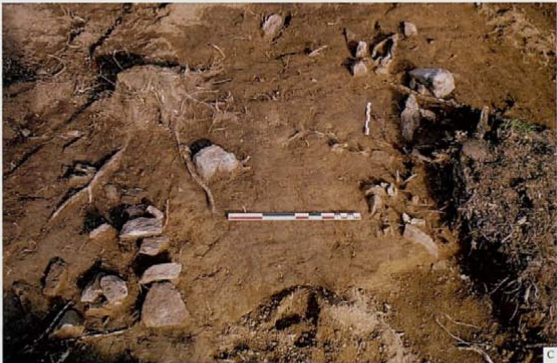
Fig. 4 : photographies des empièvements de la tranchée 76.