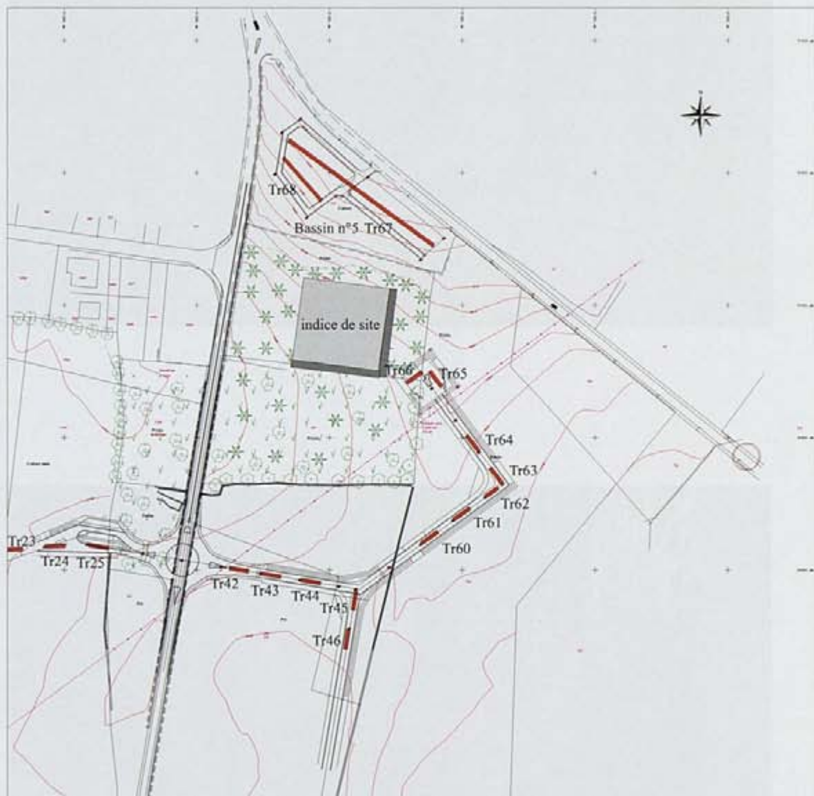
Fig. 6 : Localisation de l'indice de site dans l'emprise de la ZAC à l'extérieur des voiries sondées dans le cadre de l'opération de diagnostic.