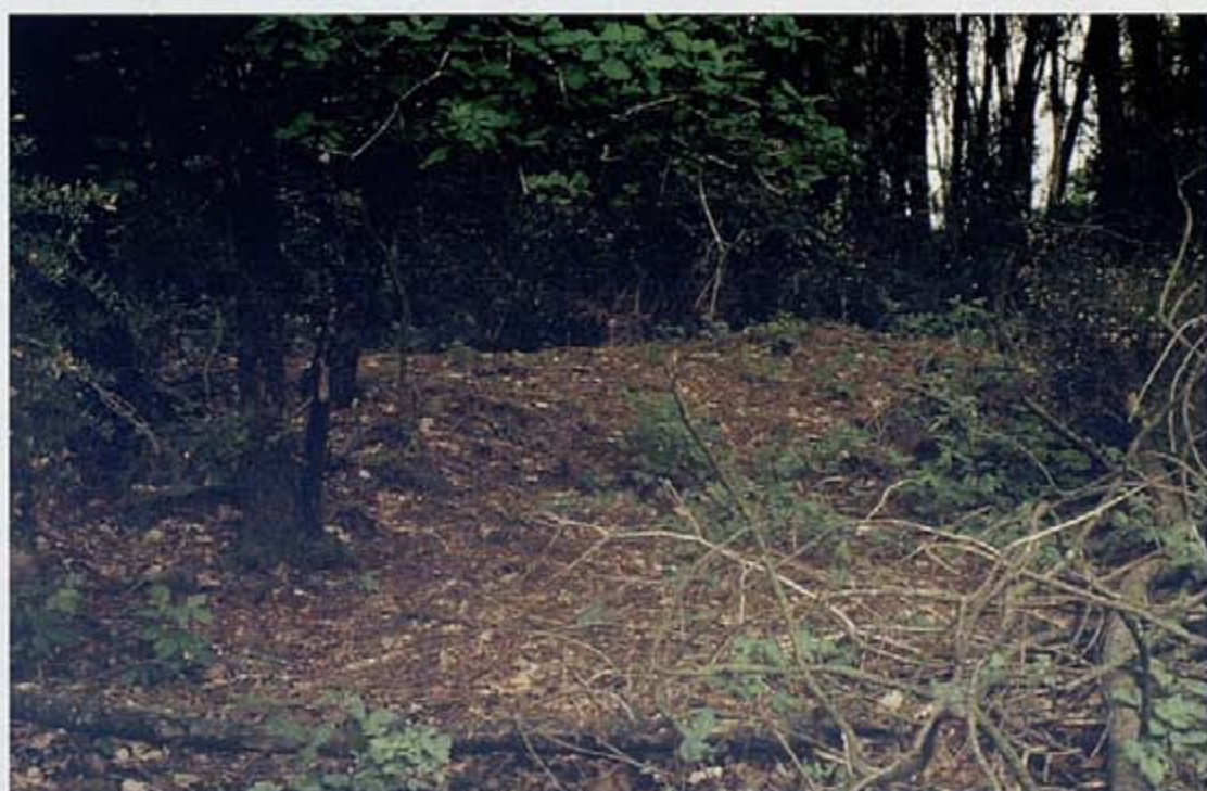
Fig. 7 : photographies du talus de l'enclos quadrangulaire déclaré comme indice de site.