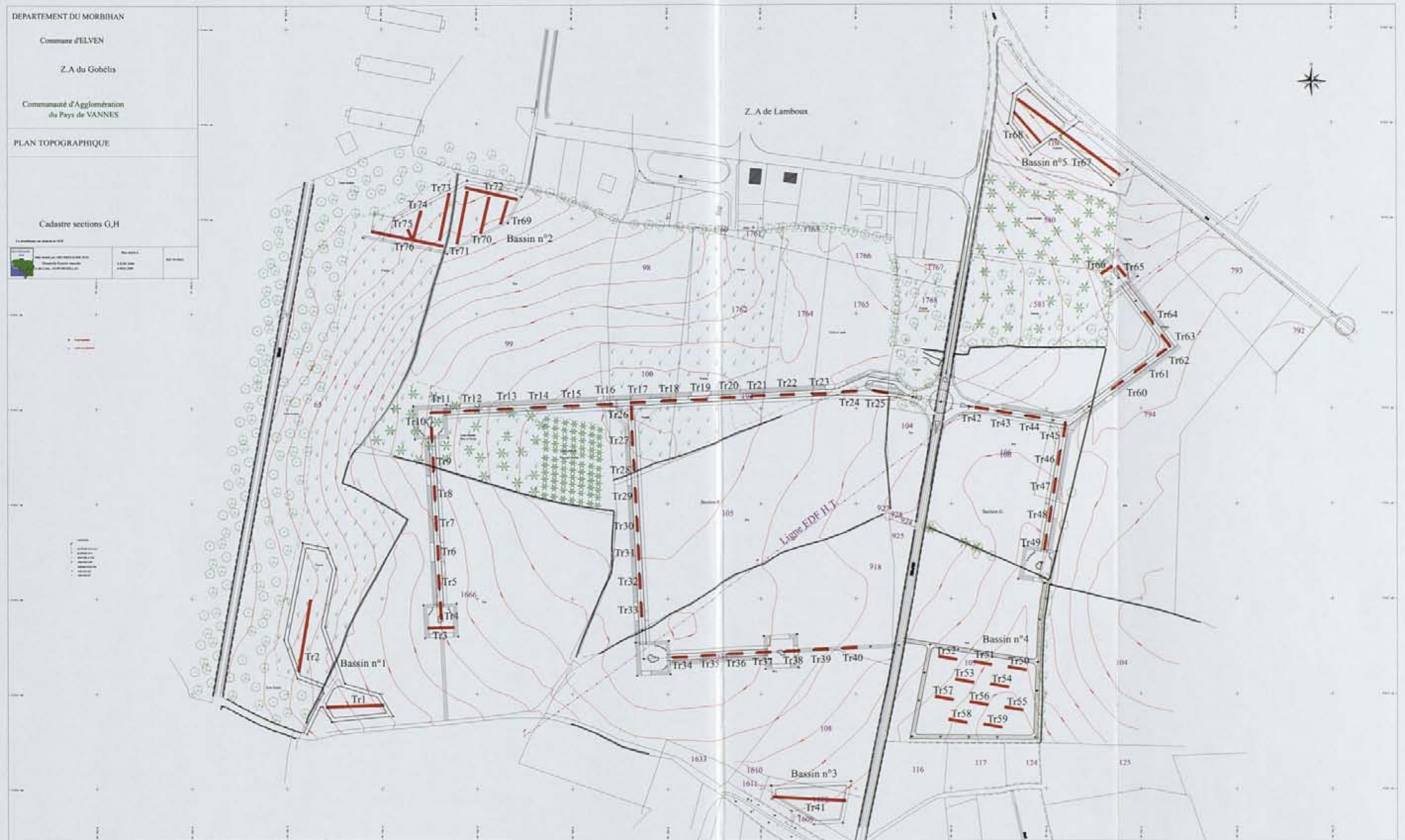
Fig. 2 : Plan cadastral avec implantation des tranchées de diagnostic.